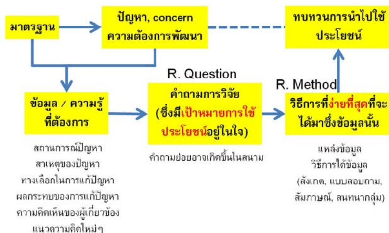
ภาพที่ 1 แนวคิดและแนวทางการทำ Mini-research

เป็นการประยุกต์แนวคิดของการวิจัยมาใช้ในการประเมินสถานการณ์หรือผลลัพธ์ของการพัฒนา โดยสามารถสรุปข้อมูลหรือความรู้ที่ต้องการได้ในเวลาอันสั้น สามารถนำข้อมูลหรือความรู้นั้นไปใช้ประโยชน์ได้อย่างรวดเร็วทันการณ์